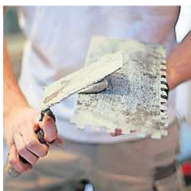
Legen die Bauarbeiter bald die Kelle aus der Hand? Streik droht.