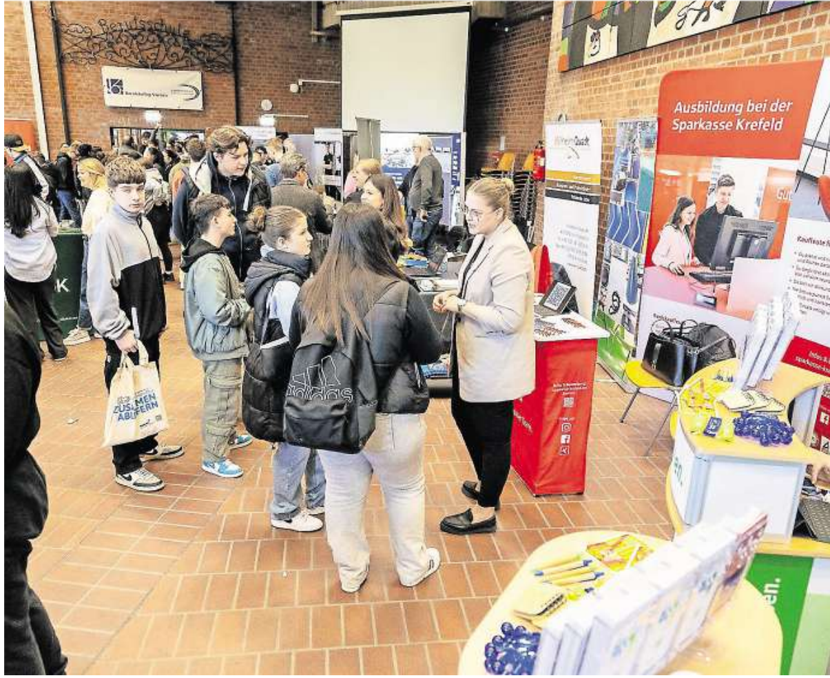
In Kooperation mit der Rheinischen Post holte Check In Berufswelt 52 Betriebe zu einer Ausbildungsmesse in das Berufskolleg Viersen. Das Interesse der Schülerinnen und Schülern der weiterführenden Schulen war groß.